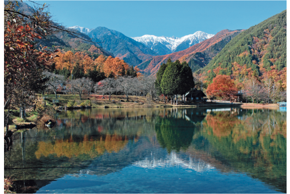
秋の駒ヶ池と中央アルプス