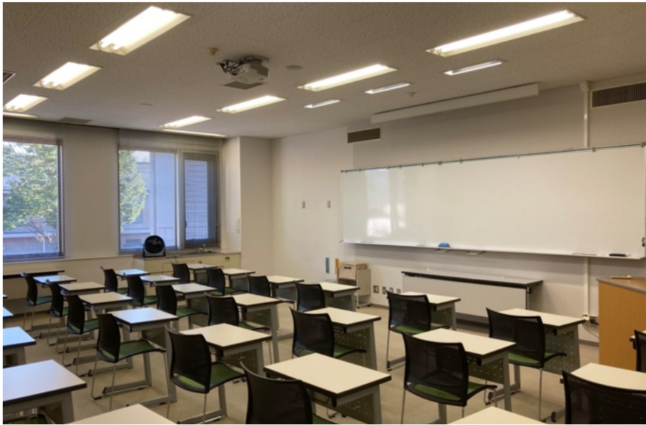
認定教育課程講義室