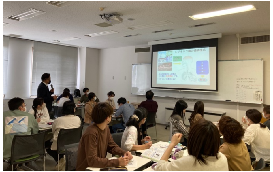
認定教育課程講義室