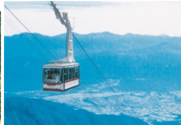
駒ヶ岳ロープウェイ